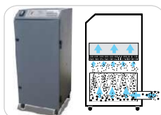
Sistema de Extracción (con filtros)