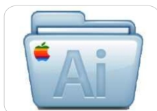
MAC Plug-In p/ Adobe Illustrator