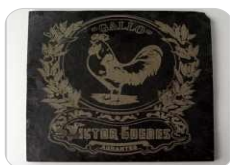
Piedra / Mármol