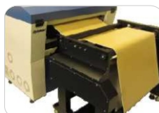
Sistema embobinador/desbobinador automático