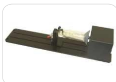
Sistema rotativo para piezas cilíndricas