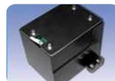
Dispositivo AAS para corte con seguimiento de contorno