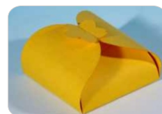
Papel / Cartón