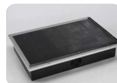
Mesa de aspiración por debajo (incluye mesa de corte)