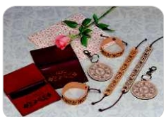
Piel / Cuero