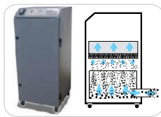
Sistema de Extracción (con filtros)