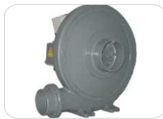
Sistema de Extracción (sin filtros)