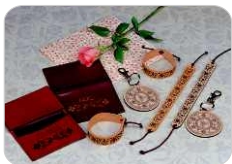
Piel / Cuero