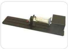
Sistema rotativo para piezas cilíndricas