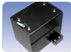
Dispositivo AAS para corte con seguimiento de contorno