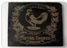
Piedra / Mármol