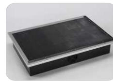
Mesa de aspiración por debajo (incluye mesa de corte)