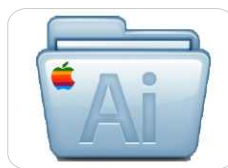
MAC Plug-In p/ Adobe Illustrator