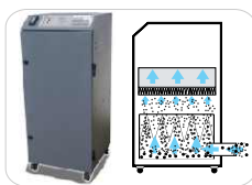
Sistema de Extracción (con filtros)