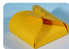
Papel / Cartão