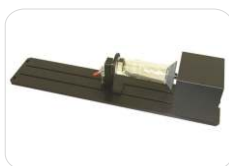
Sistema rotativo p/ peças cilíndricas