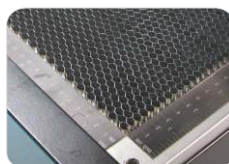
Mesa de Corte