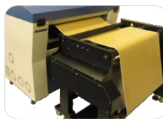
Sistema enrolador/desenrolador automático