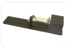
Sistema rotativo p/ peças cilíndricas