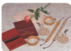
Pele / Couro