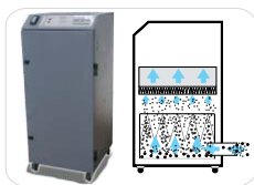
Sistema de Exaustão (c/ filtros)