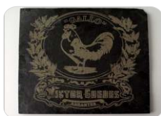
Pedra / Mármore