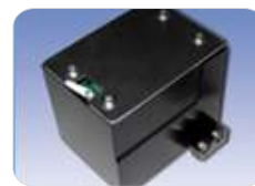
Dispositivo AAS p/ corte com seguimento de contorno Sob consulta

Sobre todos os valores mencionados acresce o IVA à taxa legal em vigor.