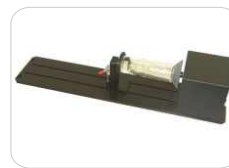
Sistema rotativo para piezas cilíndricas