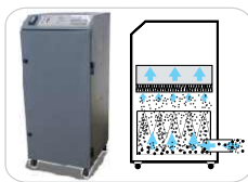
Sistema de Extracción (con filtros)