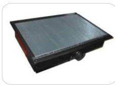
Mesa de aspiración por debajo (incluye mesa de corte)