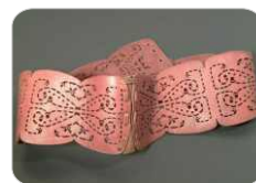
Piel / Cuero