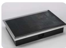
Mesa de aspiração por baixo (inclui mesa de corte)