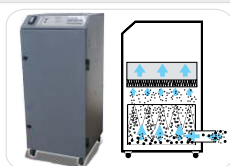
Sistema de Exaustão (c/ filtros)