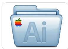
MAC Plug-In p/ Adobe Illustrator