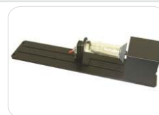
Sistema rotativo p/ peças cilíndricas