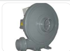
Sistema de Exaustão (s/ filtros)