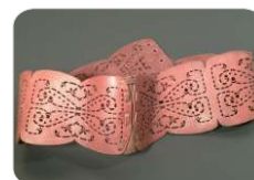
Pele / Couro