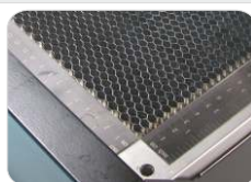
Mesa de Corte