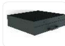
Table aspirante (avec table de découpe)