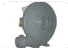
Système d'extraction (sans filtres)