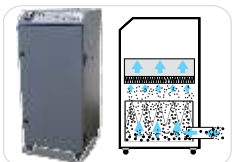
Système d'extraction avec filtration des fumées /odeurs