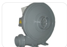
Sistema de extracción (sin filtros)