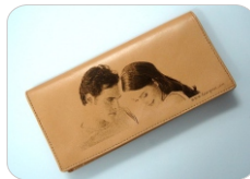
Pele / cuero