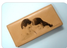
peau / cuir