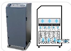
Système d'extraction avec filtration des fumées /odeurs