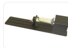
Sistema rotativo p/ peças cilíndricas