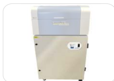
Sistema de Exaustão (c/ filtros)